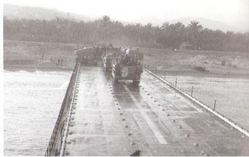
"בת שבע" - גמר פריקת סיפון עליון