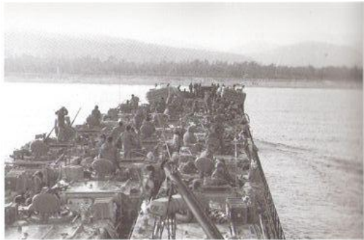
"בת שבע" - לקראת נחיתה באווליי