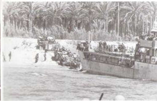
פריקת כוחות בחוף אווליי בלבנון