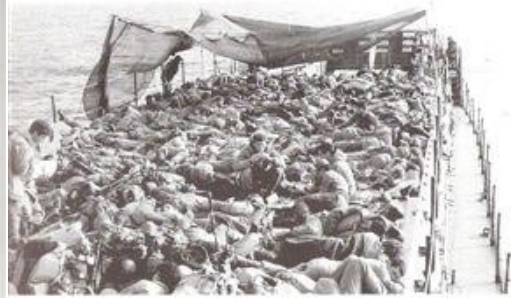
צנחנים על סיפון נט"ק 60 מ' בדרך לאווליי